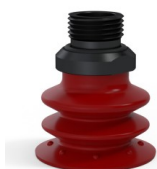
Referência da variação: 96 35SL 38D-2