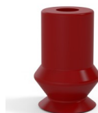
Referência da variação: 91 11SL A • Cor: Certificação CE vermelha para uso alimentar • Matéria: Silicone