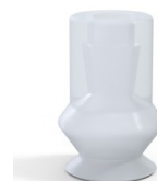
Referência da variação: 91 11SLT A • Cor: Translúcido com certificação CE para contato com alimentos • Matéria: Silicone