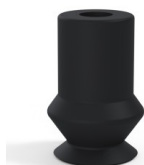
Referência da variação: 91 11NI A • Cor: Preto • Matéria: Nitrila