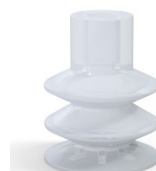
Referência da variação: 85 30SLT A