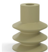
Referência da variação: 85 30CN A