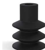
Referência da variação: 85 30NI A