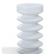
Referência da variação: 83 25SLT A