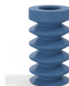
Referência da variação: 83 25SLBLEU A SH30