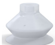
Referência da variação: 8SB 30SLT A