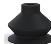
Referência da variação: 8SB 30NI A