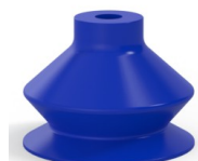
Referência da variação: 8SB 30TPUB A