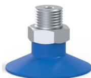
Referência da variação: 7SB 30TPUB M18