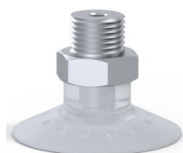
Referência da variação: 7SB 30SLT M18