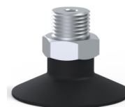
Referência da variação: 7SB 30NI M18