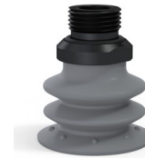
Riferimento variante: 96 35NR 38D-2-GIC