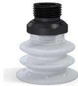
Riferimento variante: 96 35SLT 38D-2-GIC