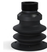
Riferimento variante: 96 35NI 38D-2-GIC