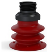
Riferimento variante: 96 35SL 38D-2-GIC