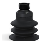
Riferimento variante: 96 35NI 14D-2