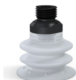
Riferimento variante: 96 35SLT 14D-2