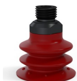
Riferimento variante: 96 35SL 14D-2