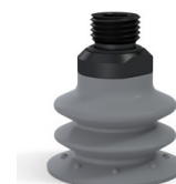
Riferimento variante: 96 35NR 14D-2