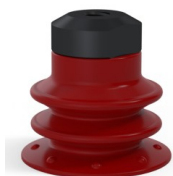
Riferimento variante: 96 25SL FM5