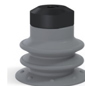
Riferimento variante: 96 25NR FM5