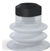
Riferimento variante: 96 25SLT FM5