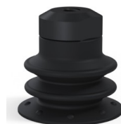
Riferimento variante: 96 25NI FM5