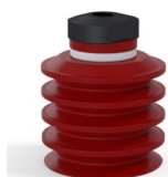
Riferimento variante: 92 50SL 18D-2