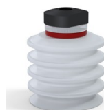
Riferimento variante: 92 50SLT 18D-2