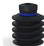
Riferimento variante: 92 50NI 18D-2