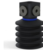
Riferimento variante: 92 40NI 18D-3-BD