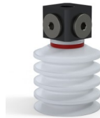
Riferimento variante: 92 40SLT 18D-3-BD