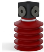
Riferimento variante: 92 40SL 18D-3-BD