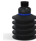
Riferimento variante: 92 40NI 14D-2-GIC