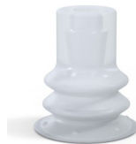
Riferimento variante: 96 15SLT A