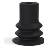
Riferimento variante: 96 15NI A