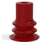
Riferimento variante: 96 15SL A