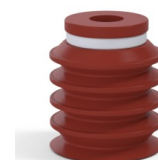
Riferimento variante: 92 20SLBRIQUE A