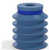
Riferimento variante: 92 20SLBLEU A SH30