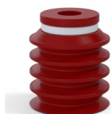
Riferimento variante: 92 20SL A