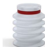
Riferimento variante: 92 20SLT A