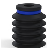
Riferimento variante: 92 20NI A