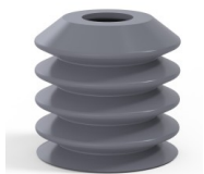
Riferimento variante: 82 40SLDG A