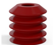
Riferimento variante: 82 40SL A