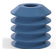
Riferimento variante: 82 40SLBLEU A SH30