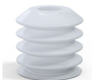
Riferimento variante: 82 40SLT A SH40