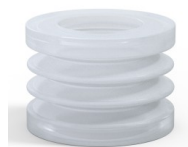
Riferimento variante: 80S 45SLT A