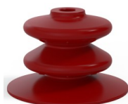
Riferimento variante: 8 120SL A