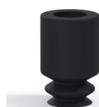
Riferimento variante: 1 05NI A