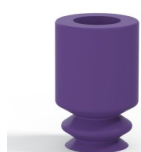
Riferimento variante: 1 05MNT A