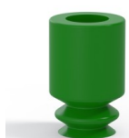
Riferimento variante: 1 05SLV A