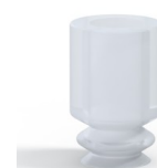
Riferimento variante: 1 05SLT A