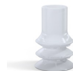
Riferimento variante: 88B 20SLT A