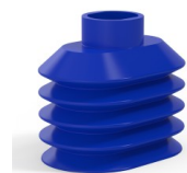
Riferimento variante: 4PA56 38 50SLBLEU A