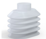
Riferimento variante: 4PA56 38 50SLT A