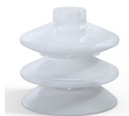
Riferimento variante: 8 87SLT A