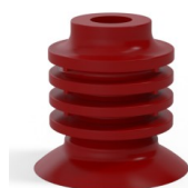
Riferimento variante: 95-2 40SL A