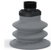
Référence déclinaison : 96 52NR 38D-2