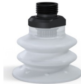
Référence déclinaison : 96 52SLT 38D-2