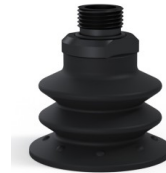
Référence déclinaison : 96 52NI 38D-2