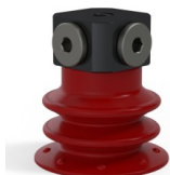
Référence déclinaison : 96 25SL FM5BD