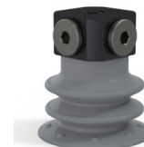
Référence déclinaison : 96 25NR FM5BD