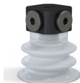
Référence déclinaison : 96 25SLT FM5BD