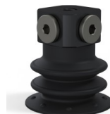
Référence déclinaison : 96 25NI FM5BD