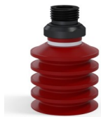
Référence déclinaison : 92 40SL 38D-2-GIC