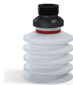
Référence déclinaison : 92 40SLT 38D-2-GIC