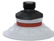
Référence déclinaison : 90 50SLT 14D-2-GIC