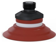
Référence déclinaison : 90 50SL 14D-2-GIC