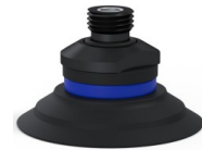
Référence déclinaison : 90 50NI 14D-2-GIC