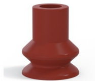
Référence déclinaison : 87A 30SLBRIQUE A