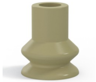
Référence déclinaison : 87A 30CN A