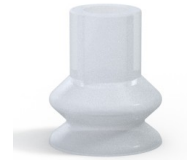
Référence déclinaison : 87A 30SLT A SH40