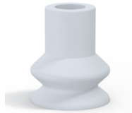
Référence déclinaison : 87A 30SLB A