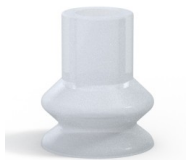
Référence déclinaison : 87A 30SLT A SH50