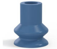
Référence déclinaison : 87A 30SLBLEU A