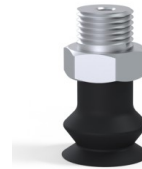
Référence déclinaison : 8SB 15NI M18