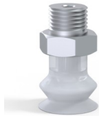
Référence déclinaison : 8SB 15SLT M18