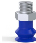
Référence déclinaison : 8SB 15TPUB M18