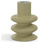
Variantenreferenz: 8B 40CN F14