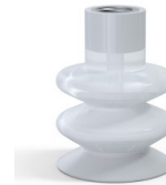
Variantenreferenz: 8B 40SLT F14