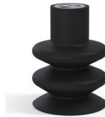
Variantenreferenz: 8B 40NI F14