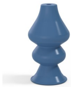
Variantenreferenz: 8 34SLBLEU A SH30