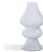
Variantenreferenz: 8 34SLT A