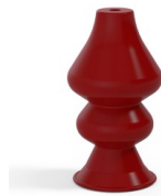
Variantenreferenz: 8 34SL A