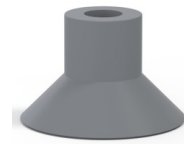
Variantenreferenz: 78 30NR A