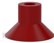
Variantenreferenz: 78 30SL/RV A