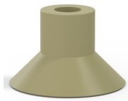
Variantenreferenz: 78 30CN A