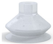
Variantenreferenz: 8SB 40SLT A