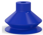
Variantenreferenz: 8SB 40TPUB A