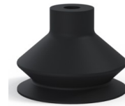
Variantenreferenz: 8SB 40NI A